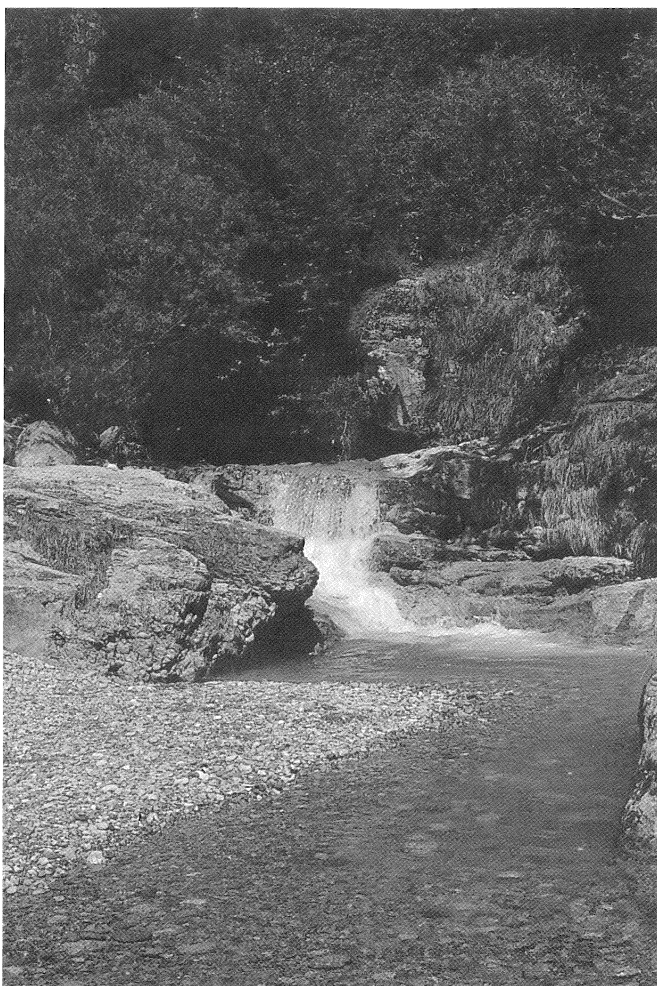
Fig. 3 - Il torrente Re in Val d'Inzino: tipico esempio di biotopo che ospita una fauna reofila, costituita soprattutto da Deronectes aubei (Muls.) e Oreodytes rivalis (Gyll.).