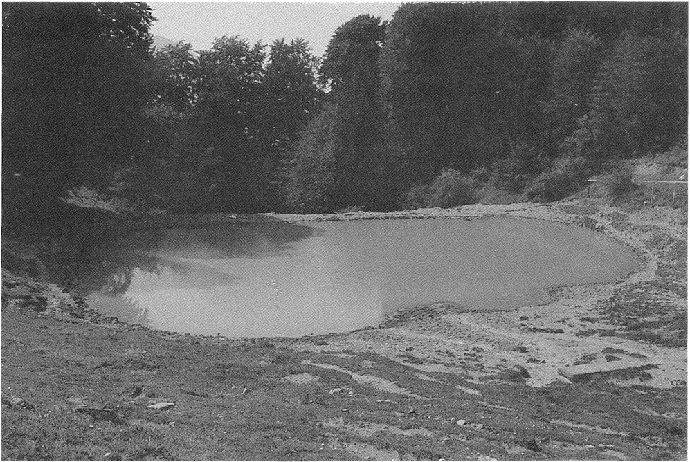
Fig. 2 - Pozza presso Malga Aguina: tipico esempio dell'ambiente delle pozze d'abbeverata distrofiche. I biotipi di questo tipo ospitano una fauna di specie euriecie; unico elemento che può dirsi caratteristico di questi ambienti è Acilius sulcatus (L.).

tiscus marginalis L., intente a predare attivamente i numerosi girini di anuri presenti nelle pozze.