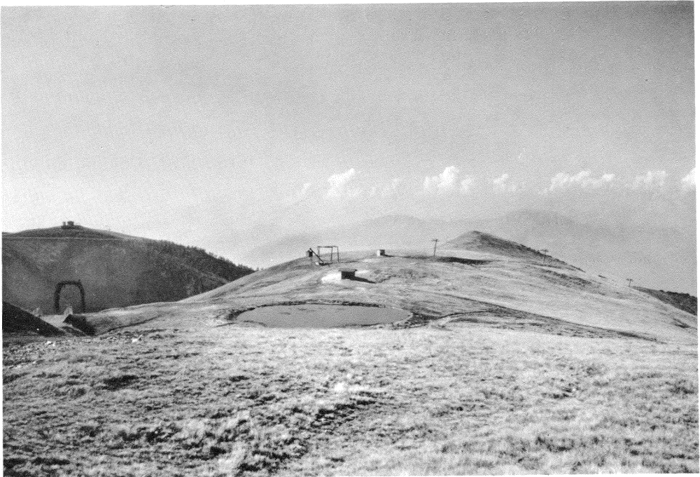
Fig. 1 - La località di ubicazione della stazione.

I reperti litici, circa una cinquantina, sono stati tutti raccolti in un'area limitata ad una ventina di metri quadrati, dove il manto erboso era stato rimosso artificialmente dai lavori connessi alla sciovia ed affiorava il substrato roccioso. Gli strumenti annoverano ipermicropunte a dorso con piquant trièdre , triangoli con tre o due lati ritoccati e troncature sempre della dimensione di un'ipermicrolamella. Sono anche presenti microlitini prossimali e distali e nuclei (fig. 2).