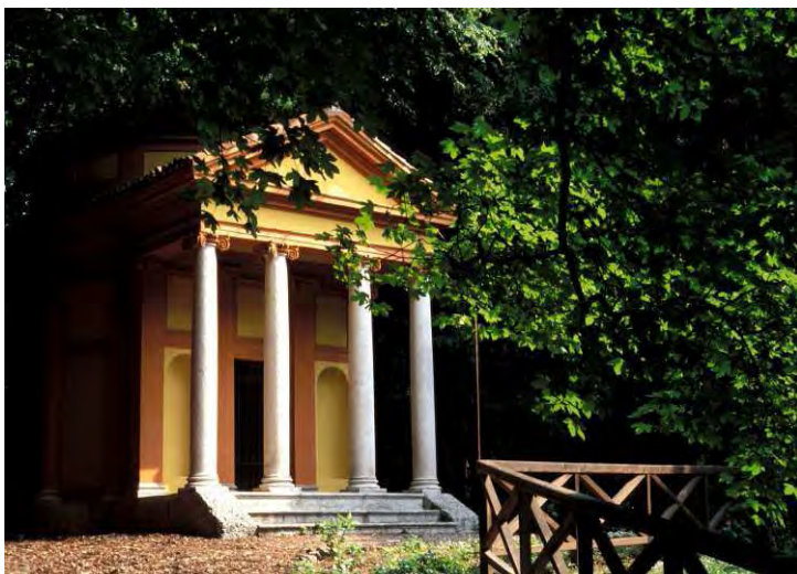
Pag. prec. e sopra: alcuni scorci del Parco della Villa Reale di Monza.