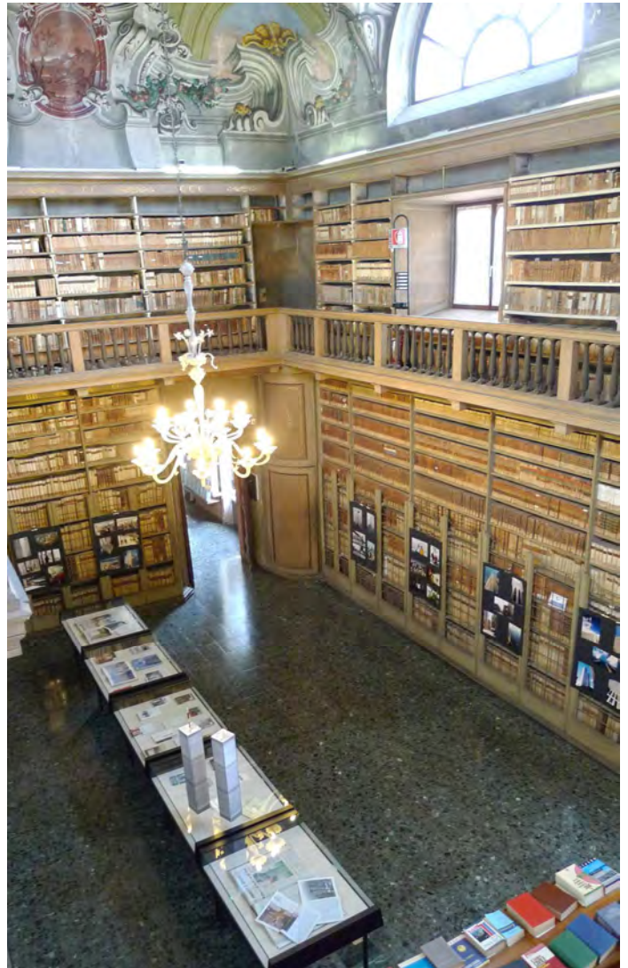
In alto: il Salone della Queriniana.