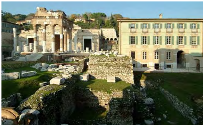
Sopra: una veduta del Capitolium e del Palazzo Maggi.

Al suo interno ha sede l'Assessorato alla Cultura e dal 1998 è allestito il Museo della città , nel quale oltre 14000 reperti e opere raccontano la storia di Brescia attraverso percorsi di grande suggestione, che si snodano negli ambienti monastici, entrando nell'area archeologica delle domus dell'Ortaglia, nella chiesa longobarda di San Salvatore, nell'oratorio romanico di Santa Maria in Solario e nel cinquecentesco coro delle monache.