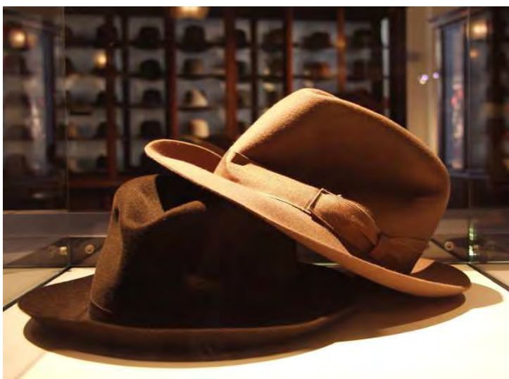
Sopra: particolare del Museo del Cappello Borsalino.

Conoscere Alessandria significa viverla: nei suoi spazi, coi suoi modi, con il suo stile originale e autentico.