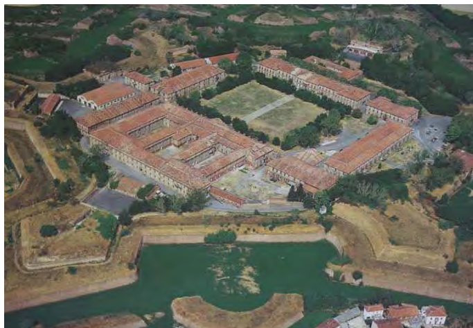
Sopra: La Cittadella.

Divina Provvidenza, la Taglieria del pelo e, soprattutto, il Dispensario antitubercolare, capolavoro razionalista e insieme suo primo superamento.