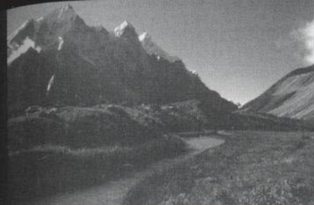
Sorgenti del fiume Gange

“Per troppo tempo dopo l'indipendenza dell'India abbiamo continuato a portare la croce della quasi schiavitù. Altre popolazioni rurali sono in una situazione simile alla nostra. Tuttavia, ora che tutto è chiaro e c'è unanimità nelle istituzioni, anche tra i deputati e gli